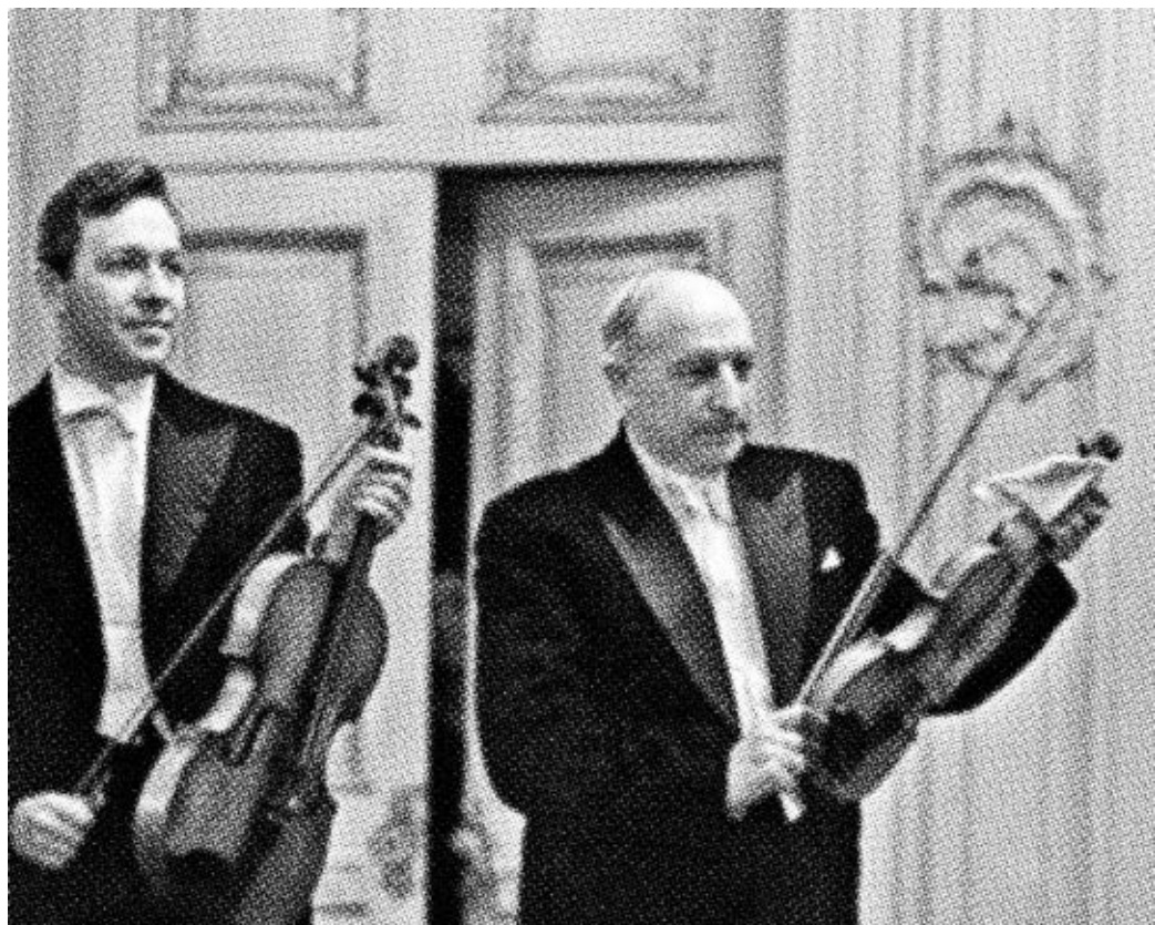
Dmitrij Šostakovič s členmi Beethovenovho kvarteta

Je máj roku 1937 a pred výťahom jedného z leningradských obytných blokov stojí muž okolo tridsiatky. Stojí tam celú noc a čaká, že si po neho prídu. Nikto z mocných, ktorých kedysi poznal, mu nemôže pomôcť. Takto začína Julian Barnes svoju najnovšiu knihu The Noise of Time , ktorej hlavným hrdinom je Dmitrij Šostakovič (1906–1975). Umelca, ktorého život pripomína ťaživú existenciálnu drámu s prvkami absurdnej frašky, charakterizovala ruská skladateľka Sofia Gubajdulina (1931) ako „stelesnenie tragédie, bolesti a teroru našich čias“. Šostakovič sa narodil v cárskom Sankt Peterburgu, v Petrohrade bol svedkom Októbrovej